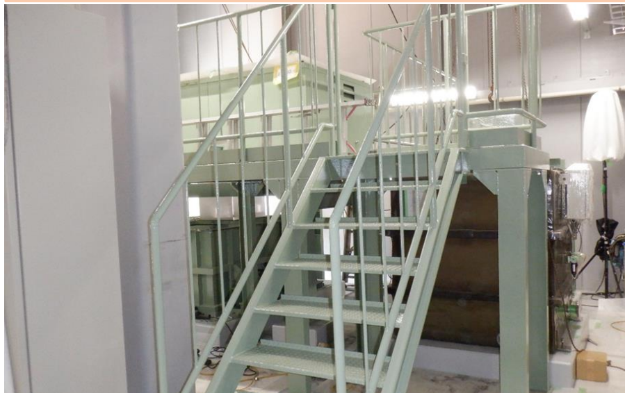
③ 浸出水処理施設内のプラント工事状況