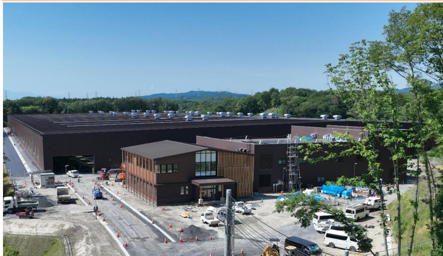
① 埋立地（被覆施設）・管理棟・浸出水処理施設の全景