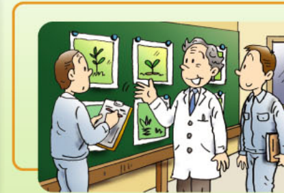
専門家の意見聴取

移植した植物などについては、経過観察などの事後調査や管理を行うことを検討していますが、具体的な内容や方法などについては、専門家の意見を聞きながら計画します。