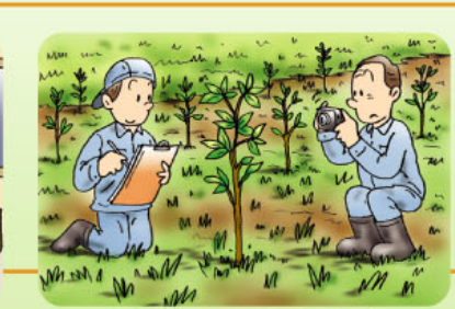
貴重種の生育状況の記録