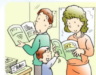
データ等の情報公開

大気、水質、騒音・振動などのモニタリングの結果を広報誌、ケーブルテレビなどにより情報公開します。