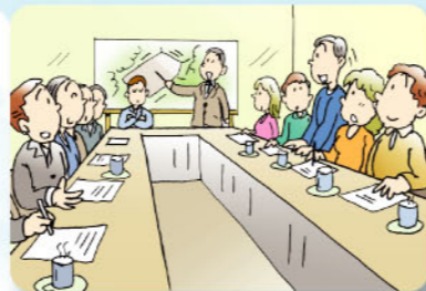
コミュニケーションの場

住民監視システムでは、住民の皆さん、行政、学識者が連携することにより、処分場の適正な管理運営を行うための組織をつくります。この組織では、最終処分場の安全性に関する共通認識を持って処分場の管理運営を監視していきます。