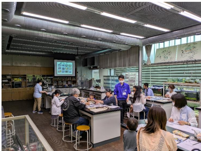
エコバッグの作成（お絵かき）