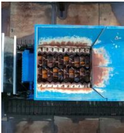
破碎機（不法投棄物を埋立するため細かくします）