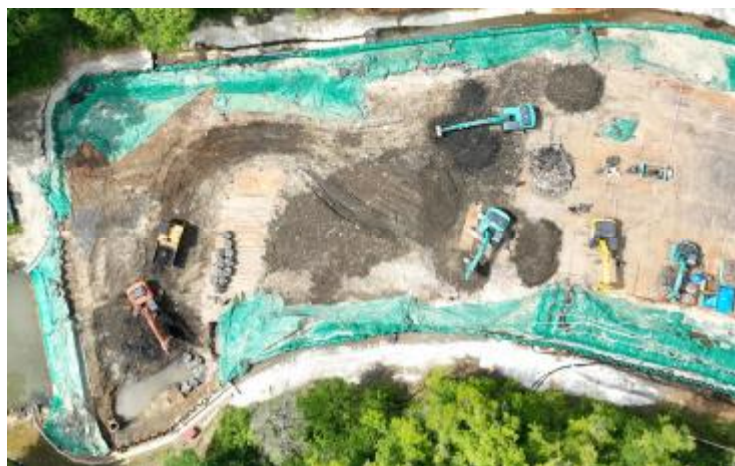
不法投棄地の掘削の状況