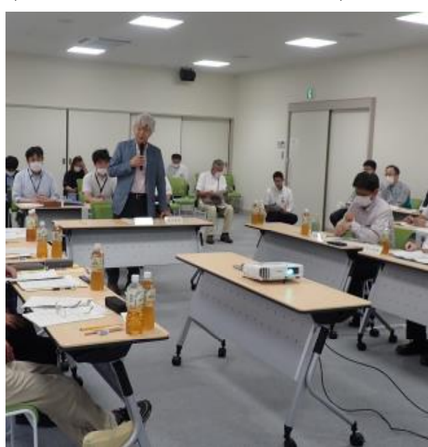
(安全推進協議会の様子)