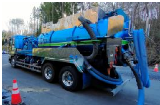
汚水の運搬に用いる車両