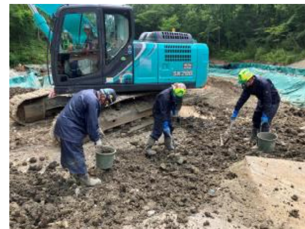
不法投棄地における選別状況