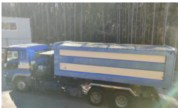
不法投棄物の運搬に用いる車両