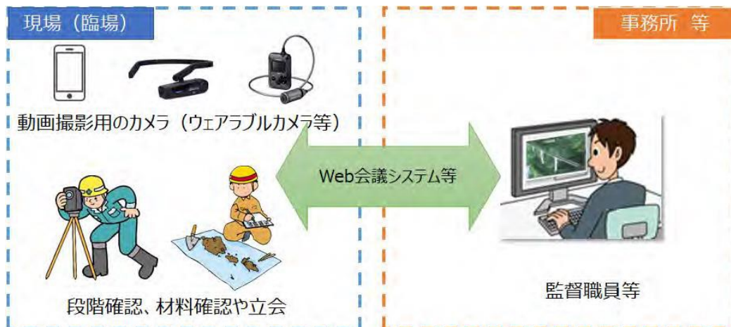
図 2-1 機器構成（例）