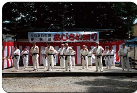
四つ竹タカセの皆様