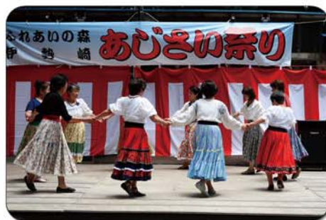
フォークダンスたんぼぼの皆様