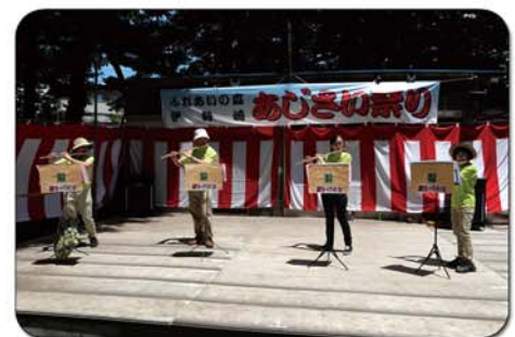
真岡フルーツアンサンブルの皆様