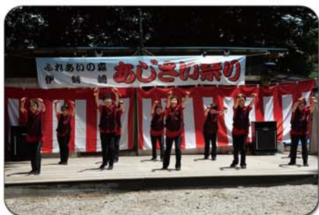
四つ竹タカセ(さくら会)の皆様