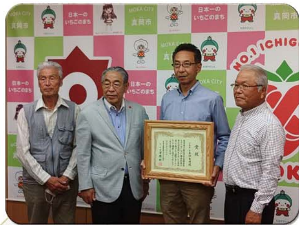
6月16日(木)に真岡市長へ受賞について報告しました

『継続は力なり』先人たちの言い伝えは本当のことだということを感じております。今後とも皆様方のご協力よろしくお願ひします。