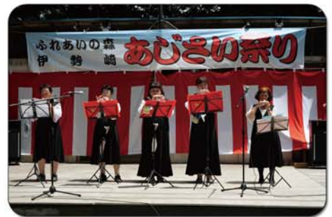
ユ・タンポボの皆様