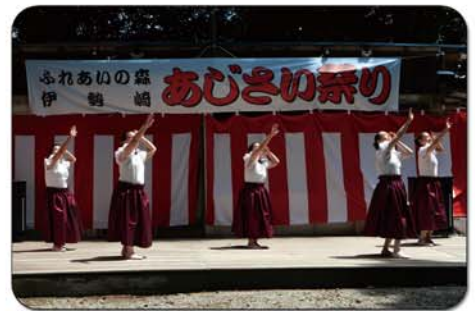
ワイナニ フラストジオの皆様