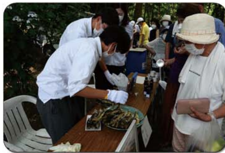
馬頭高校水産科生徒による実習製品販売