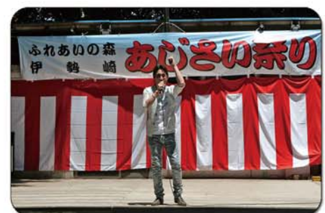
特別参加 北川かつみ(新曲キャンペーン)