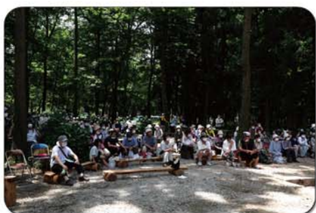
こんな感じで聴衆していました