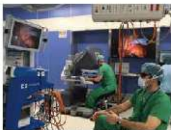
レジデントのロボット支援手術実演風景

全国の医学生・初期研修医の皆様、こんにちは。自治医科大学 腎泌尿器外科学講座主任教授の藤村哲也です。私のセールスポイントはロボット支援根治的前立腺全摘除・腎部分切除術・根治的膀胱全摘除術1,000例を超える経験です。“1000例を20例で伝える”を目標に日々、若い先生に技術の伝承を熱心に行っています。