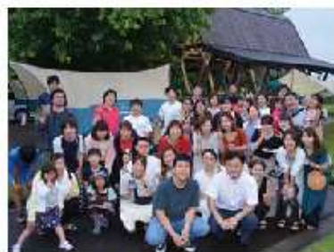
2018年に実施したレクリエーション