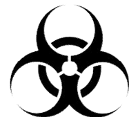
バイオハザードマーク

《注》表示は全国共通のものが望まれるため、右記のバイオハザードマークを推奨しますが、マークをつけない場合は「感染性廃棄物」と明記してください。