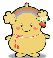
栃木県 老人福祉施設協議会 イメージキャラクター とちぶくちゃん