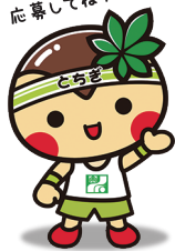
栃木県マスコット キャラクター とちまるくん