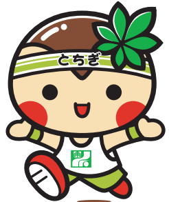
とちまるくん