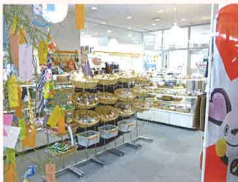
ナイスハートショップ (とちぎ福祉プラザ1階) 宇都宮市若草 1-10-6 ☎ 028-622-0433

市役所・町役場の売店、道の駅、JAの直売所、入浴施設、観光施設、地元のスーパーなど、身近なところでお求めいただけます。