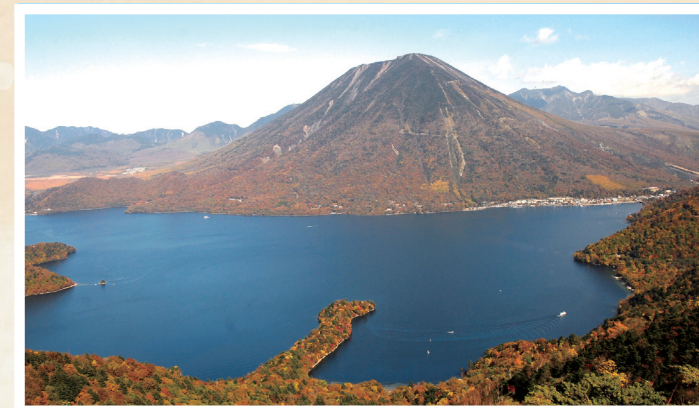
男体山と中禅寺湖(日光市)