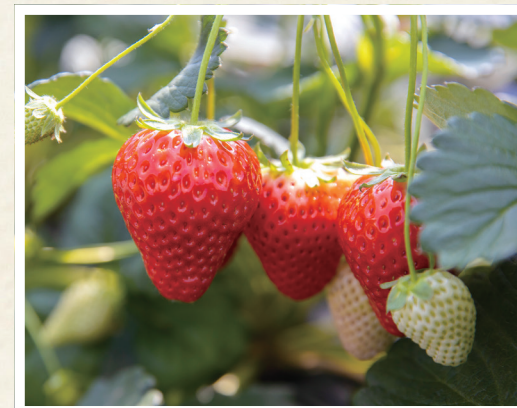
とちぎのいちご(栃木県)