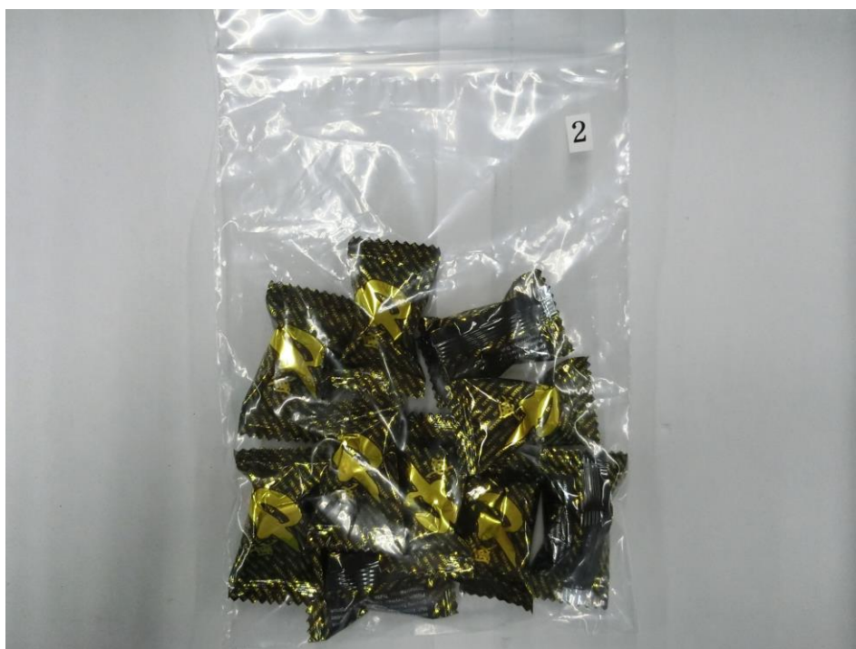
威力キャンディー