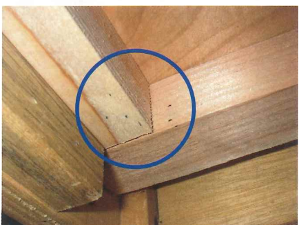
▲このような1~3個のわずかな糞にも注意 小さな墨色の点、又はそれより小さい黒い点 (約1~2mm) (糞の大きさも個体により異なる)