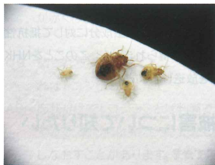
▲幼虫も大きさが違うので注意 4匹とも幼虫 (約1~4mm)

脱皮して大きくなるたびに色が濃くなり茶色になります。最終的には身体全体が濃茶色になります。脱皮は5回して成虫になります。