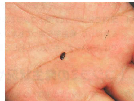
▲トコジラミの成虫 (約5~8mm) 手のひらと比較する (約6mm)