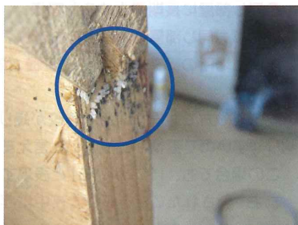
▲卵と糞が一緒のこともある 1mmくらいの卵と糞が同時に見られる (卵は約1mm 糞は約2mm)