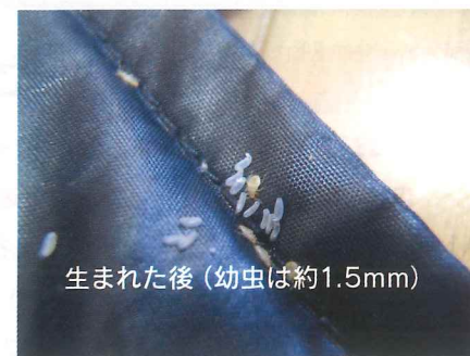
▲生まれたばかりの極めて小さい幼虫