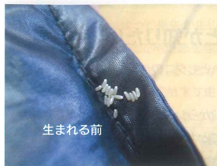
▲卵は極めて小さくて白っぽい (約1mm)