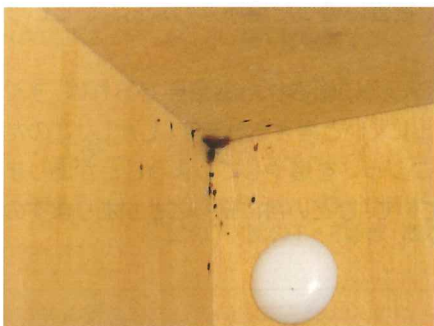
▲クローゼットの上部隅にいる成虫と糞