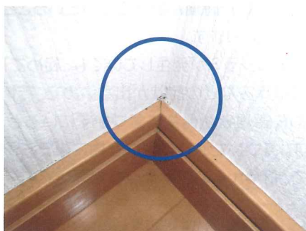
▲部屋の隅・角の下部にも注意