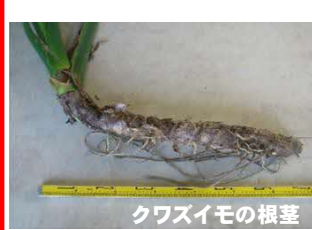
クワズイモの根茎