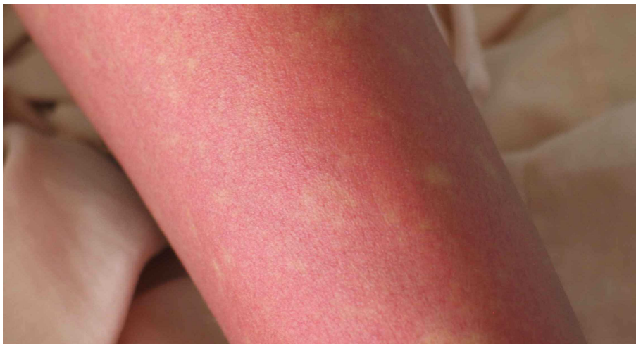
図 2. デング熱患者の発疹：解熱時期にみられた島状に白く抜ける紅斑