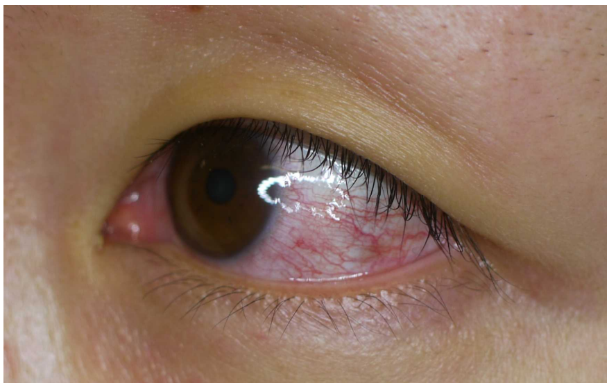
図4. ジカウイルス病の充血性結膜炎