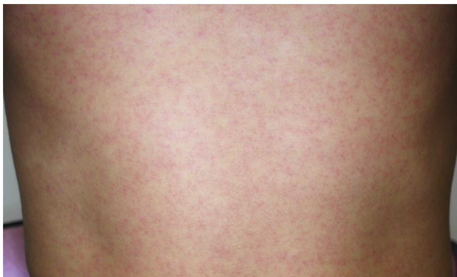
図3. ジカウイルス病の斑状丘疹様の発疹

潜伏期間は、2～12日（多くは2～7日）である。ジカウイルス病の臨床症状は多彩であるが、斑状丘疹様の発疹（ 図3 ）は90～100%に認められるのに対して、発熱の頻度は35～65%とされている 25,45,46 。また発疹は掻痒感を伴うことが多いとされている。また、大半の症例は入院を必要としなかった。 表7 に2015年のブラジル・リオデジャネイロにおけるジカウイルス病患者が発症後4日以内に認めた臨床症状を示す 45 。