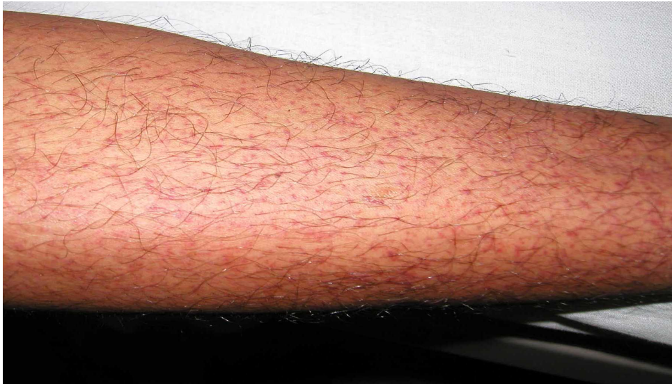
図 1. デング熱患者の発疹：解熱時期にみられた点状出血