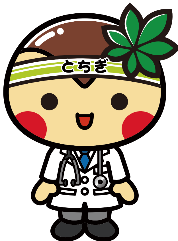
とちまるくん

マメ て な あら 手 せき 洗いと咳エチケットで 「かからない」、「うつさない」。