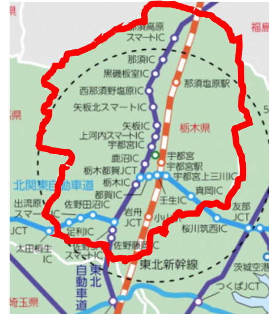
《促進区域図》栃木県全域（25市町）

栃木県産業技術センター、（公財）栃木県産業振興センター、とちぎ産業振興協議会（戦略3産業）、とちぎ未来技術フォーラム、とちぎ地域企業応援ネットワーク 等