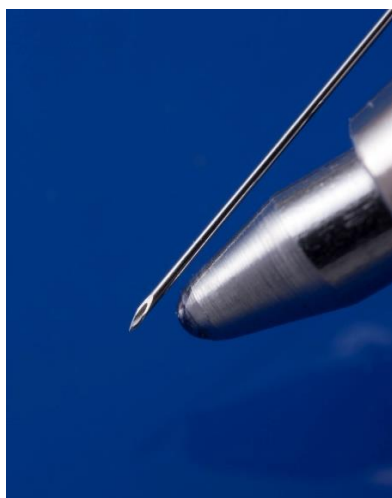
【外径0.18、内径0.09極細針 ボールペン先の比較 美容整形針】

当社では特殊分野の医療用注射針製造を得意とし、毎月500種類ほど、小さくは数百本～多くて数百万本のロット数で、月産数7千万本程、年間8億本余り製造しています。針は主に血液に触れる針を軸に「安全機能+穴付き留置針」「人工透析用留置針」「透析用AVF針」「献血用針」「インシュリンポンプ用針」「ワクチン投与特殊針」「麻酔用硬膜外針」「脊髄針」「美容整形針」「プレフィルド用針」「生検針」「人工授精採卵針」などを製造しています。他にも長尺針(全長500mm～1700mm)で特殊用途針の製造も手掛けています。