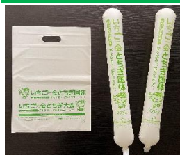
バイオマスプラスチックフィルム

豆腐の搾りかすである「おから」とプラスチックを混ぜ合わせ、フィルム化することに成功しました。資源の有効活用と石油由来材料の使用量を削減する地球にやさしいフィルムです。