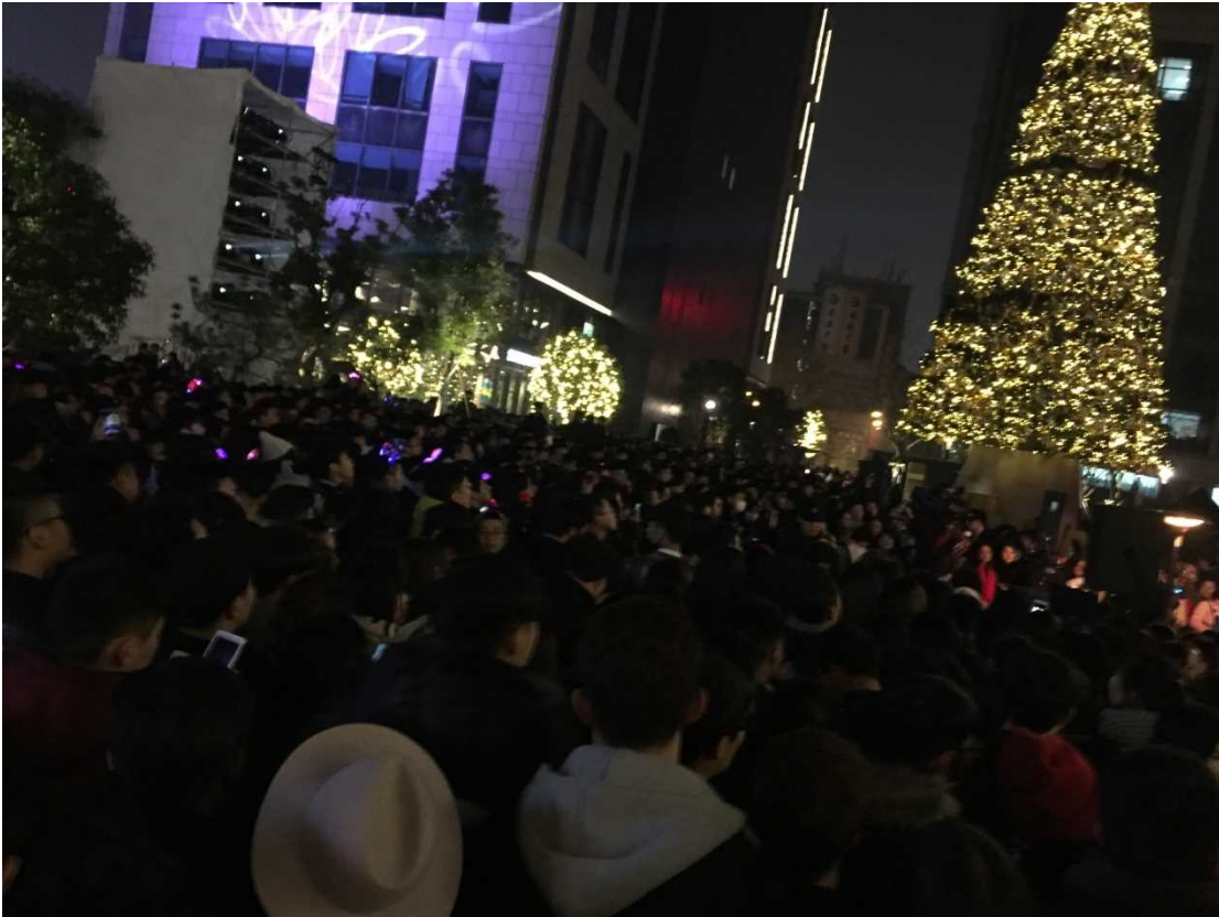
※カウントダウン会場

行く前は中国には旧正月の文化があるので、新暦の新年は欧米の人が多くと思っていたのですが、いざ行ってみると、若い中国人が多く驚きました。