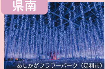
あしかがフラワーパーク（足利市）