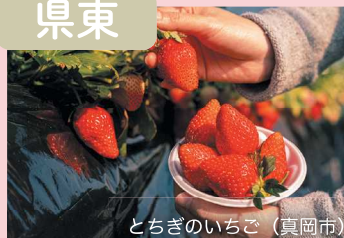
とちぎのいちご（真岡市）