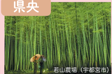
若山農場（宇都宮市）