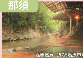
塩原温泉（那須塩原市）