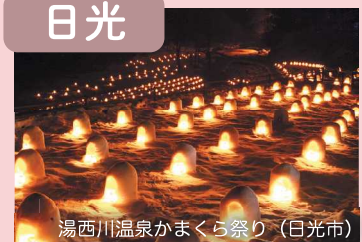
湯西川温泉かまくら祭り（日光市）