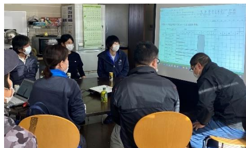
農場、関係者の検討会