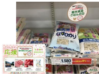
消費拡大キャンペーンの実施