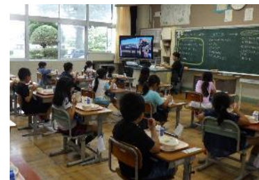
給食の時間に動画を視聴する児童たち