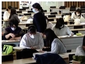
学生同士のグループワーク