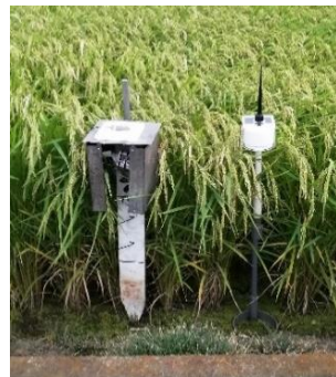
圃場における気象データ測定の様相 (左：梨、右：水稻) (経営技術課)