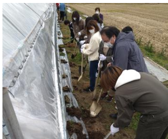
いちご農家での農業体験