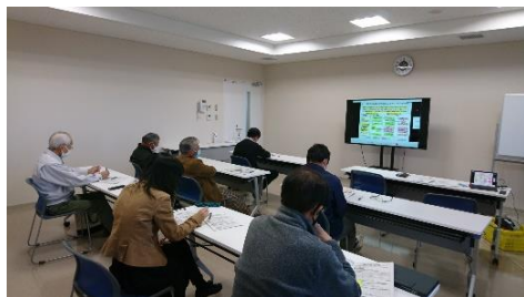
GAP推進セミナーの様子