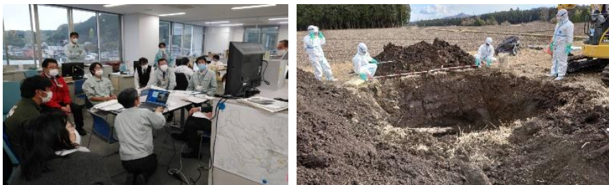
演習(左)と実際の防疫作業(右)