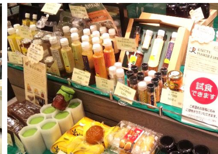
人気の六次郎商品