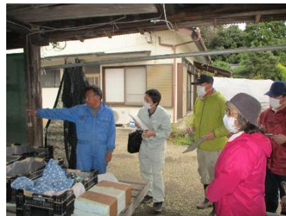
JA生産組織での農場点検デモ