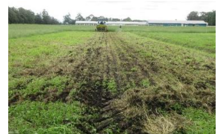
試験ほ場追播の様子 (畜産酪農研究センター)