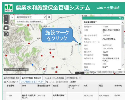
農業水利施設保全管理システムの画面イメージ