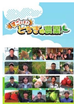
小中学校に配布したDVD