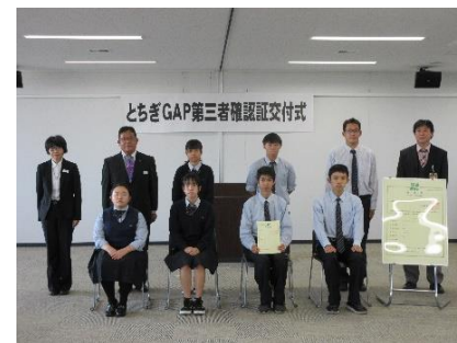
とちぎGAP第三者確認証交付式(鹿沼南高校)