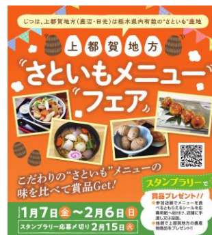
「さといもメニューフェア」