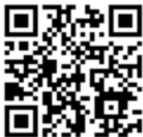
農業水利施設保全管理システムのQRコード