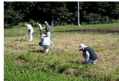
試験ほ場での作業風景