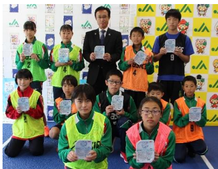
パックごはん贈呈式(11月28日)