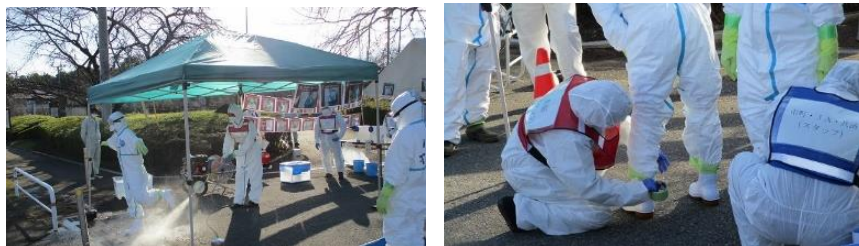
防疫拠点での演習の様子 (下都賀農業振興事務所)