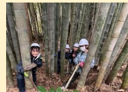
ボランティア活動