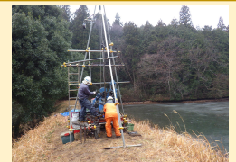
農業用ため池の健全度評価