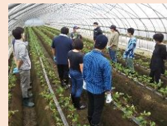
いちご新規就農希望者向けの定植体験会