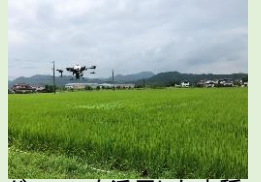
ドローンを活用した水稲への追肥作業