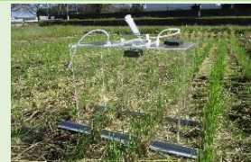
水田からの温室効果ガス排出削減試験(メタンガス採取)

本県農業の顔となるオリジナル品種や生産性の高い新技術の開発を進めるとともに、気候変動や温室効果ガス排出削減など環境の変化や時代のニーズに適応した農業技術の開発・普及により、本県農業のイノベーションを促進します。