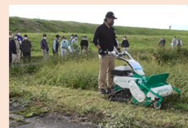
地域での高性能草刈機導入に向けた実演会