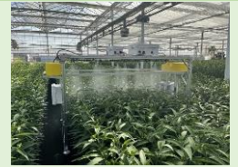
AI搭載無人走行防除車両による薬剤散布