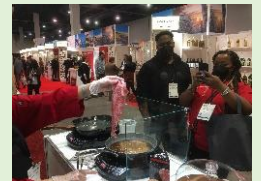
アメリカでの見本市におけるとちぎ和牛試食・PR