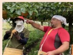
農業マイスターによる新規就農者への指導

産地が主体となった新規参入者を受け入れる新たな体制づくりを進めるとともに、農業を学ぶ機会の充実を図り、栃木で農業に取り組む多様な人材の確保・育成を進めます。