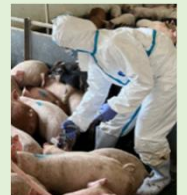
子豚への豚熱ワクチン接種