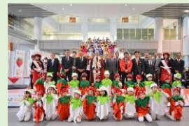
「いちご王国・栃木の日」5周年記念イベント

「いちご王国・栃木」を最大限に生かしてブランド発信力を強化するとともに、オリジナル品種のブランド価値の深化を図り、国内外で「選ばれる栃木の農産物」の実現を目指します。