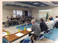
集落営農組織の連携に向けた話し合い

高齢化などにより農家が減少する中、地域農業を持続的に支えていくため、担い手への一層の農地集積・集約や、広域的に営農を展開する法人などの新たな担い手の育成を図るとともに、多様な人材など地域の力を結集した農業の仕組みづくりを進めます。