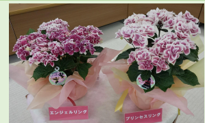
アジサイの県オリジナル品種「エンジェルリング」、「プリンセスリング」