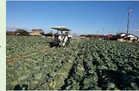
キャベツの機械収穫

水田を活用した競争力の高い大規模園芸産地の育成を進めるとともに、先端技術の導入や団地化を進め、省力的で効率的な稲・麦・大豆の生産体制を確立します。