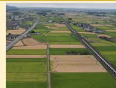
作業効率が良い、整備された水田

農地や農業水利施設などの農業生産基盤の整備や管理により、良好な営農条件を備えた優良農地を確保するとともに、農村地域の防災・減災力の強化と安全性に配慮した次世代型の農村環境の整備に取り組みなど、安全・安心で住みよい農村づくりを進めます。