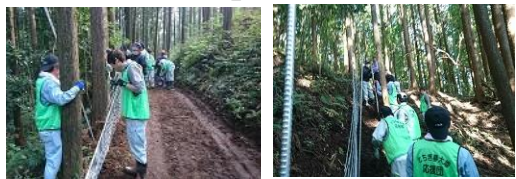
●実施事業: とちぎ夢大地応援団推進事業 (中山間地域元気創出事業)

参加者からは、「傾斜地での柵の設置が大変だった」、「全員で協力することの大切さを学ぶ良い機会となった」との声がありました。