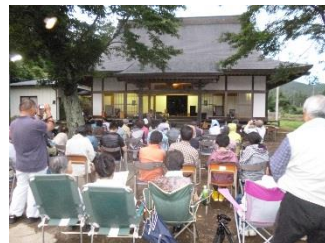
●実施事業: 中山間地域人材養成・活用事業 (中山間地域元気創出事業)

講演後の鑑賞会では、ホテルが飛び始めると、子供達が1匹2匹と数えはじめるなど、我先にホテルを見つけようと元気な声が飛び交いました。