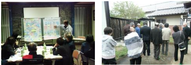
●実施事業: 地域活動サポート支援事業(中山間地域元気創出事業)

鹿沼市西大芦地区では、廃校になる小学校跡地の利活用について、鹿沼市と県上都賀農業振興事務所のサポートのもと、地域住民組織によるワークショップ(写真左)や先進地視察(写真右)が行われています。11月10日に開催されたワークショップでは、校舎や関連施設の具体的な利用方法について、活発な意見交換が行われました。