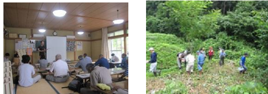
●実施事業: 獣害対策地域リーダー育成事業

野生鳥獣による農作物被害対策に関する専門的な知識を取得する第一歩となる研修となりました。