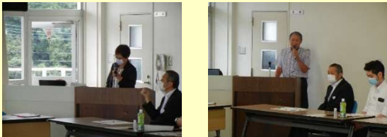
●実施事業：令和2(2020)年度とちぎ夢大地応援団推進事業

また、新型コロナウイルス感染拡大の中での活動のあり方や、高齢化、過疎化などの課題についての意見交換が行われました。