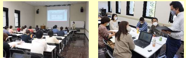
●実施事業：令和2(2020)年度中山間地域人材養成実践講座

講座では、チームリーダーがクラウドファンディングのプロジェクトを立ち上げ、実際に資金調達をするなど実践的に取り組みました。