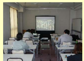
●実施事業：令和2(2020)年度中山間地域連携推進事業

今後もみなさんに地域の情報を提供していきます。 御意見、御感想をお寄せ下さい。 (連絡先) 〒320-8501 栃木県宇都宮市塙田1-1-20 栃木県農政部農村振興課 TEL 028-623-2334 FAX 028-623-2337 Eメール noson-sinko@pref.tochigi.lg.jp