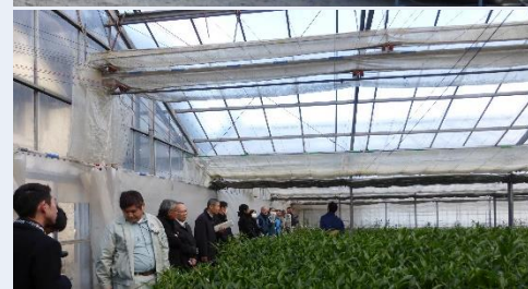
EVIによるハウスの天窓開閉