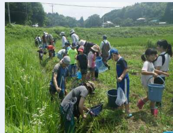
地域住民とともにモニタリング調査