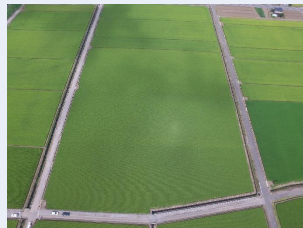
2.6haのスーパー大区画水田