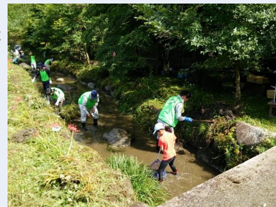
ボランティア等による保全活動