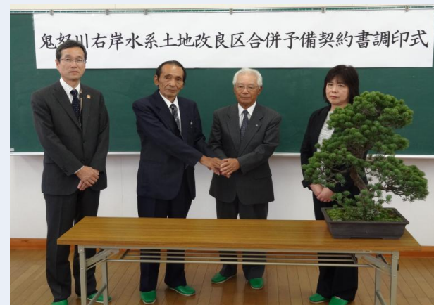
合併予備契約調印式