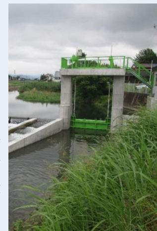
防災減災対策が実施された施設(赤坂堰)