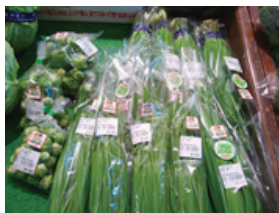
さかがわのお米と農産物