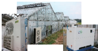
ヒートポンプ(左)と過熱水蒸気式暖房機(右)