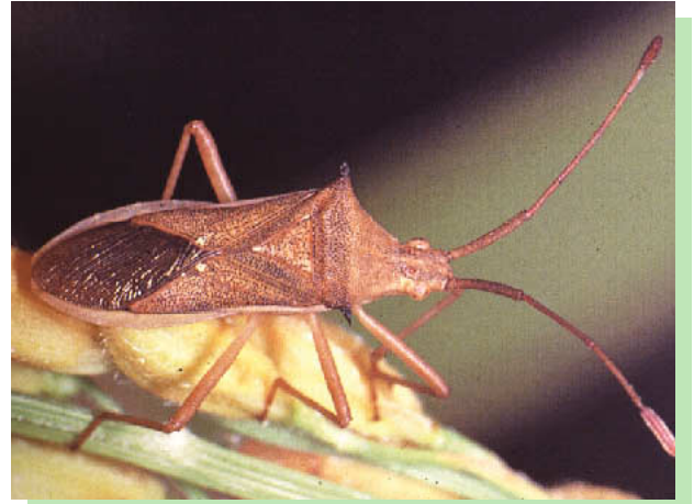
図8 ホソハリカメムシ