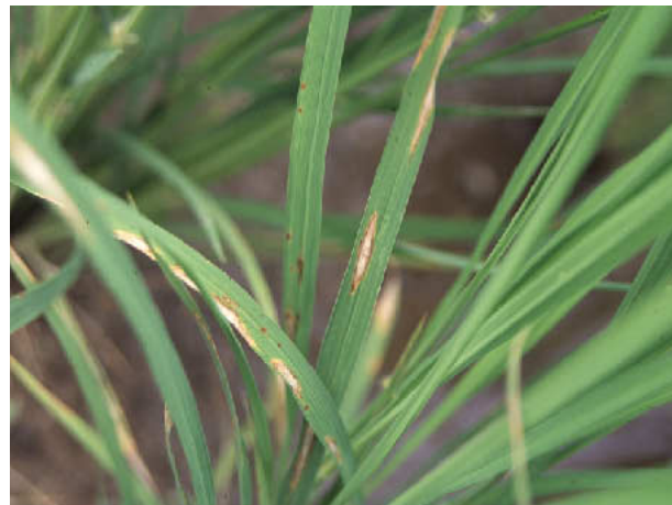
図2 葉いもち（停滞型病斑）