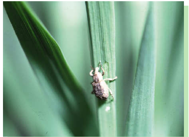
図10 イネミズゾウムシ