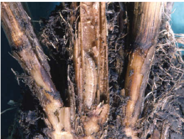
図11 ニカメイガ幼虫 (ニカメイチュウ)