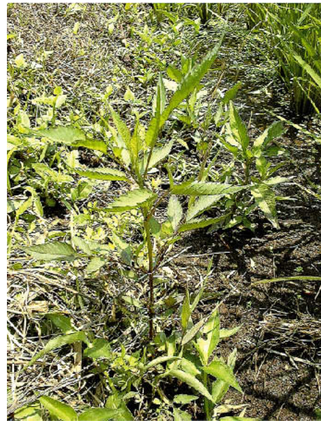
図16 アメリカセンダングサ