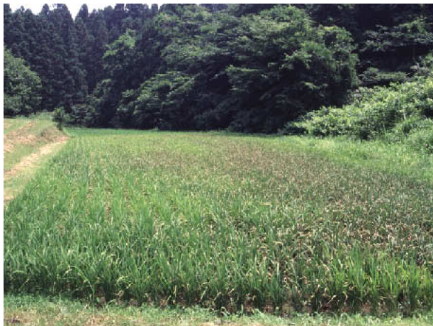
図1 葉いもちによるすり込み症状