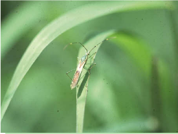
図7 クモヘリカメムシ