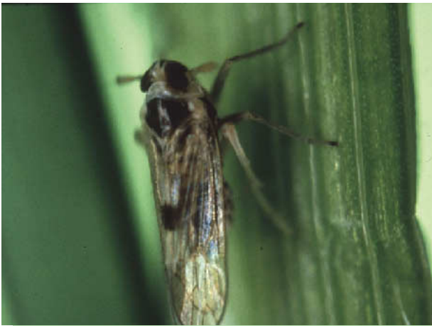
図9 ヒメトビウンカ