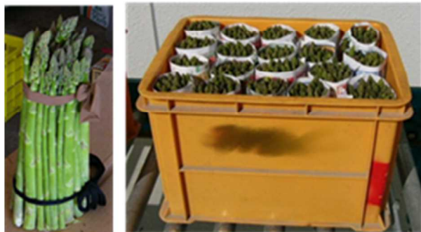
写真 予冷時のコンテナ収容