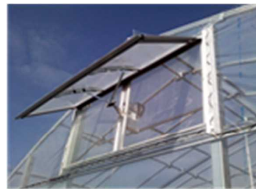
写真 妻面の窓換気