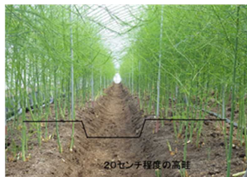
写真 管理機で徐々に作った高畦