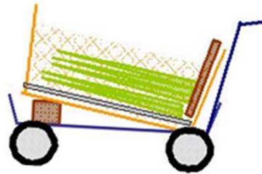
図 収穫用カートの工夫