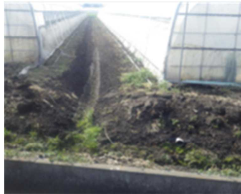
写真 ハウス脇の排水溝の設置の状況（左：排水溝まで傾斜を付けカーペット被覆。