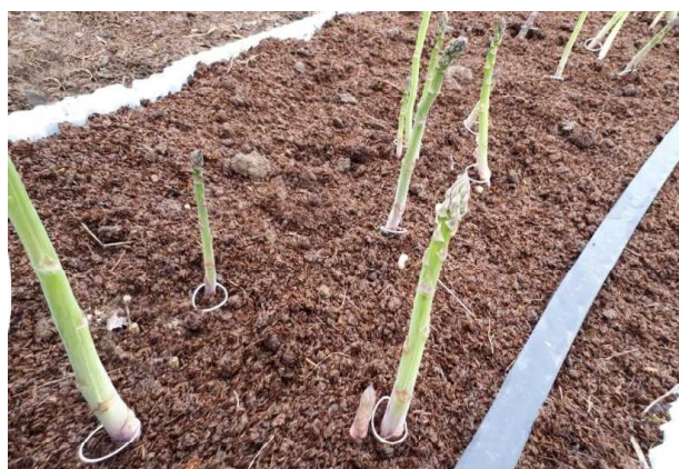
写真 輪ゴムで立茎の目印