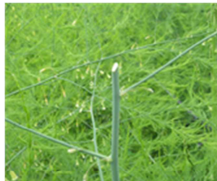
写真 摘心した成長点 (斜めの切り口)

○ただし、茎葉の極端な刈り込みは、樹勢を落とし、若茎の発生を一時停止させることになるので行わない。