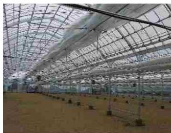
カーテン開放の状況