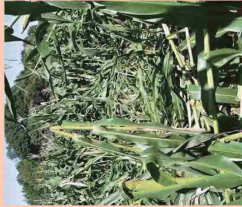
強風で倒伏した飼料用とちもろこし