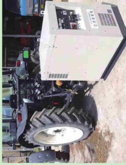
トラクターのP.T.O.を利用する発電機