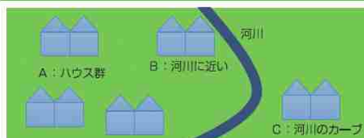
図 ハザードマップの例

川が近いハウスでは、表面の排水は良好でも、地下部は湿潤状態になりやすい場合があります。連棟ハウスの場合、基礎石があっても土が湿潤になることで地耐力が低下し、基礎そのものが沈下し勾配不良になるケースがあります。そこで雪解け水に対して、排水対策は通常のハウスより更にしっかりと行う必要があります。河川の氾濫に巻き込まれる恐れのあるハウスもチェックしておきましょう。