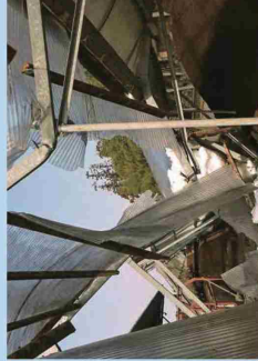
降雪被害を受けた乾燥ハウス