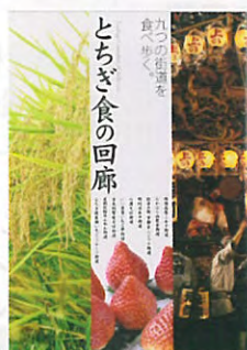
とちぎ「食」の回廊ガイドブック