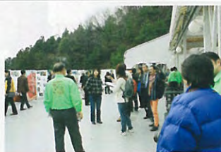
マスコミ等を対象にしたツアーコンベンション