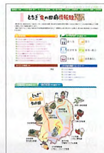
ホームページによる情報発信