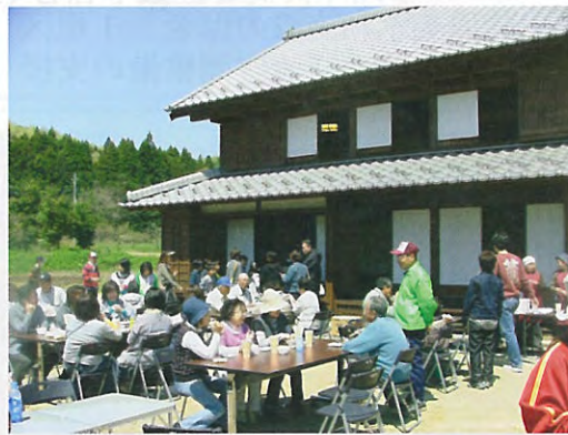
とちぎ交流施設の整備（名草地区）