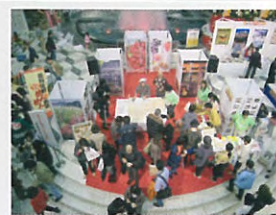
サンシャインシティにおけるイベント