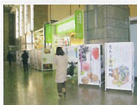
都庁全国観光PRコーナーでのイベント