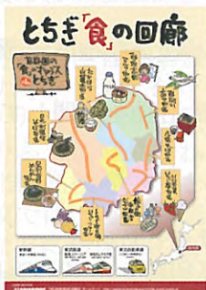
とちぎ「食」の回廊ポスター

9つの「食の街道」が設置され、各街道では地域の特色を活かした地域づくりが進められています。県では、これらの街道情報を「とちぎ食の回廊」情報として、県内外に発信するとともに、イベント等を開催し、栃木県のイメージアップと各街道への交流人口の拡大を推進しています。