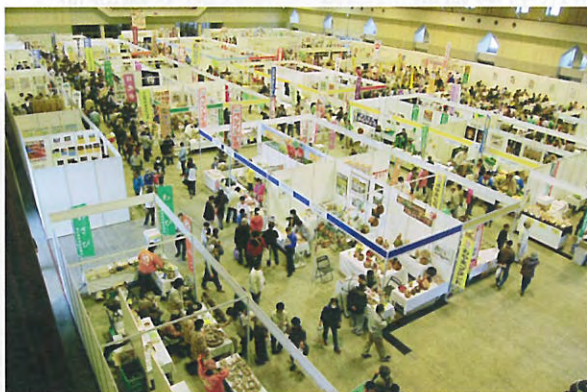
とちぎ“食と農”ふれあいフェア2010