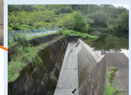
洪水吐:鉄筋が露出