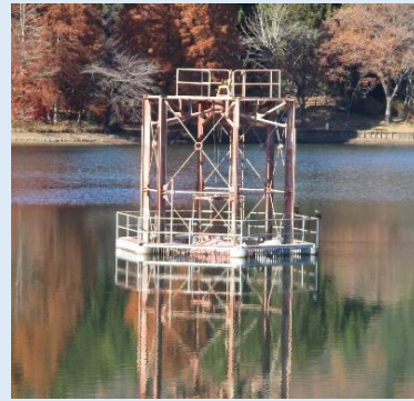
取水塔:劣化が進む