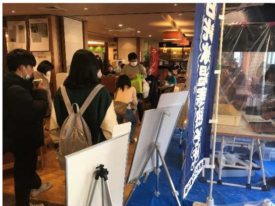
宿泊客でにぎわうPRブース

ホテルロビーで催した同会による「そば打ち」の実演では、多くの宿泊客が足を止め、職人技に見入っていました。また、手打ちそばは「夜鳴き蕎麦」として宿泊客に提供されました。今後も観光事業者と連携した上都賀地域の“そば”の魅力を発信していきます。