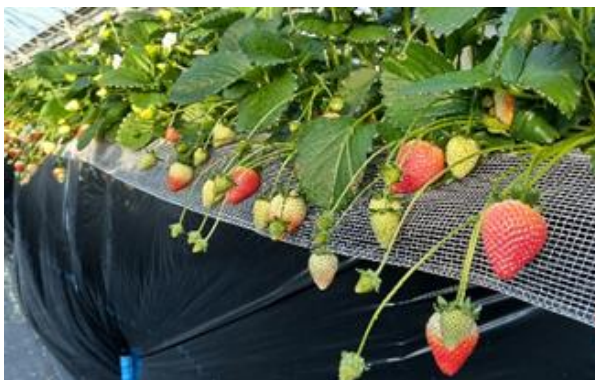
「とちあいか」の栽培状況

今後は、「とちあいか未来創りサポートチーム」によるきめ細かな支援に加え、ICT機器の導入も進め、「とちあいか」の安定生産を進めていきます。