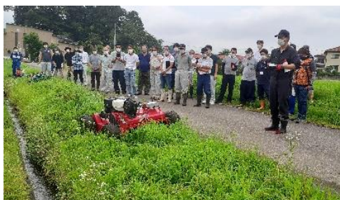
ラジコン草刈機の実演