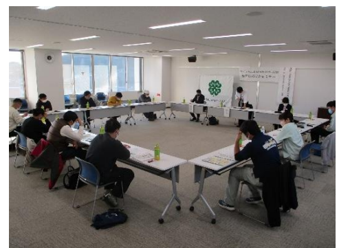
地区4Hクラブ経営技術改善セミナー