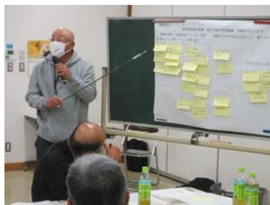
グループ毎に方針案を発表