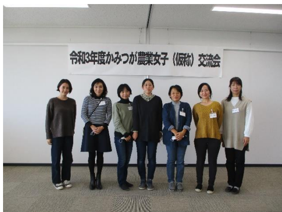
かみつが農業女子結成

メンバーの拡充を図るとともに、SNSを活用したミーティングや研修会・交流会をとおして、引き続き女性の経営参画を支援していきます。