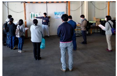
日光市にら体験会