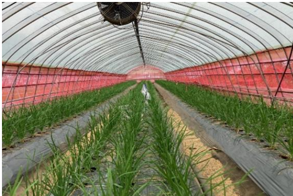
ハウス内の物理的防除の状況