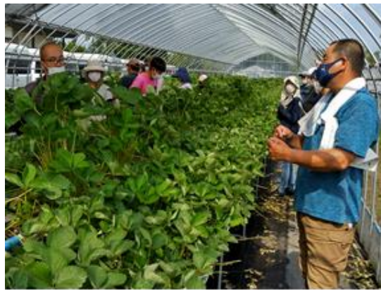
いちご親株管理現地検討会 (R4.6/13 鹿沼市)