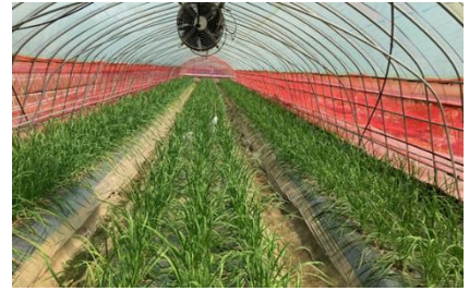
にら新作型の実証ほ場の状況

対象名：JA かみつが各野菜生産組織、管内野菜生産者、 野菜栽培志向農家、JA かみつが等