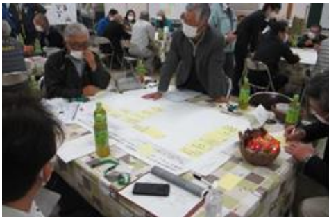
「南押原の農業を考える会」の様子