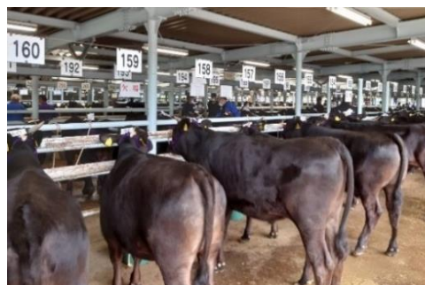
矢板家畜市場の様子