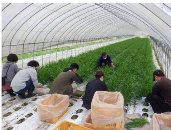
鹿沼市にら収穫調整体験

引き続き関係機関と連携し、募集期間の前倒しや各種HP・広報誌により周知を図り、新規就農者の確保に向けた普及活動を展開します。