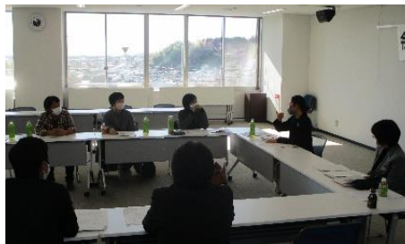
かみつが農業女子交流会