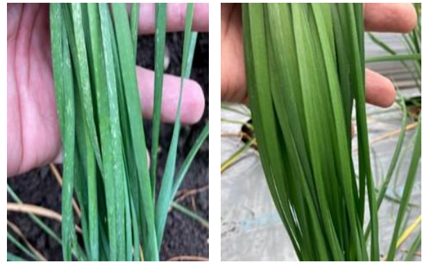
アザミウマ類の食害（左：従来 右：本法）