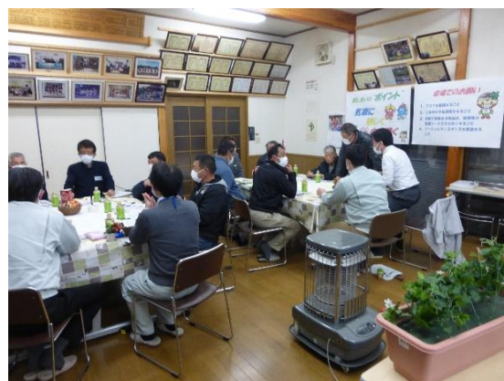
轟地区のワークショップ