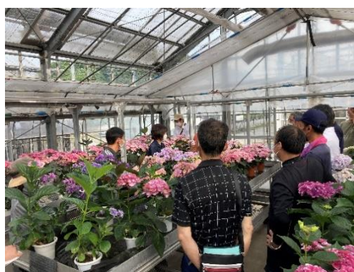
県育成あじさいの検討