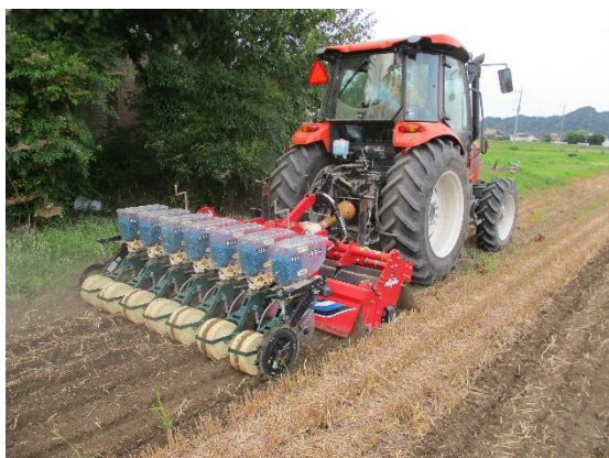
一発耕起播種機による播種作業

今後は、土壌分析の結果（可給態窒素含量等）に応じた鶏糞ペレット施用量の調整を行うことが必要になります。