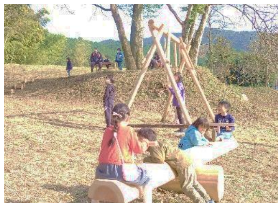
「カソトモの森パーク」で遊ぶ子ども達