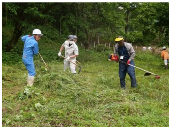
耕作放棄地の整備

今後は、「カソトモの森パーク」を活用し、加蘇地域の魅力を満喫できるような都市農村交流活動を展開していく予定です。