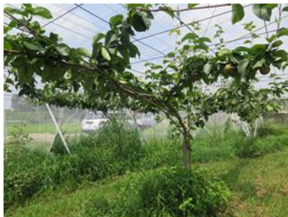
新一文字整枝の実証