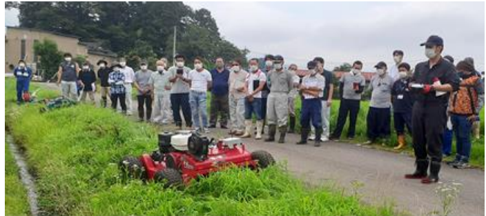
ラジコン草刈機の実演（R4. 7. 19 畦畔管理セミナー）