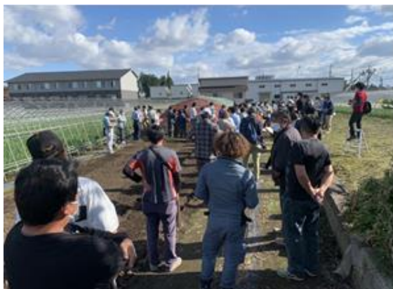
にら新作型展示ほ現地検討会 (R4.10/14 鹿沼市)