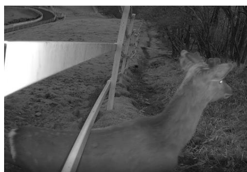
前日光放牧場（鹿沼市） センサーカメラで捉えた鹿の画像