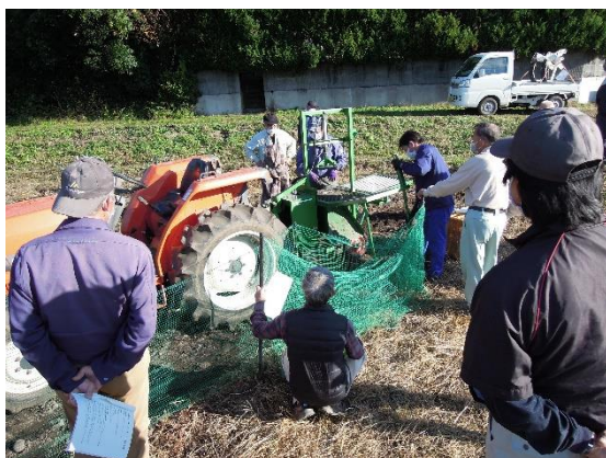
収穫実演会の様子

今後は、引き続き土地改良区への面的推進と水稻農家への個別巡回を軸に、機械実演会・研修会を開催して更なる推進を図ります。