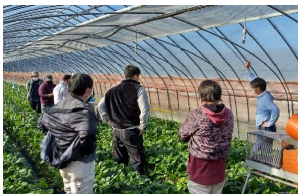
とちあいかの現地検討