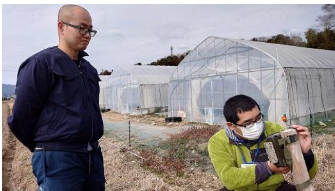
ハクビシン出現状況調査（センサーカメラ設置）