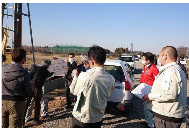
海道地区を視察する玉田地区の担い手

今後とも地域に根ざした営農構想作りを促進させ、新規ほ場整備地区を推進していきます。