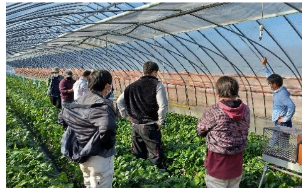
「とちあいか」現地検討会の様子