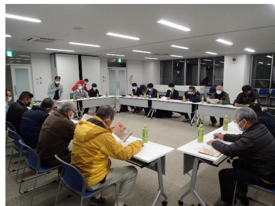
土地改良区への説明会