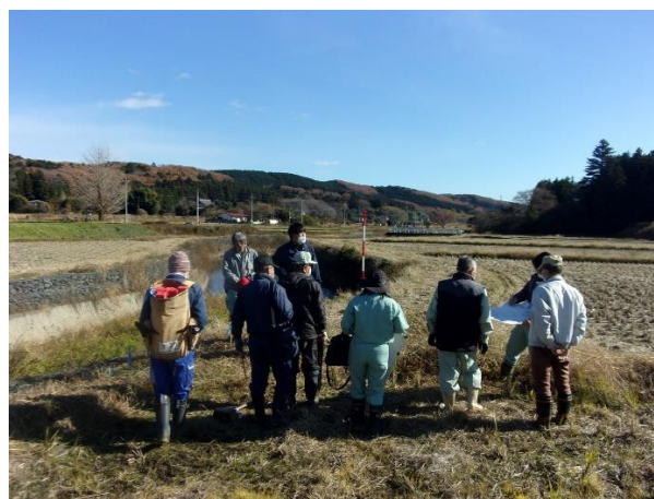
地区界立会いの様子