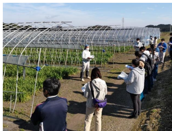
日光市にら農家ほ場見学