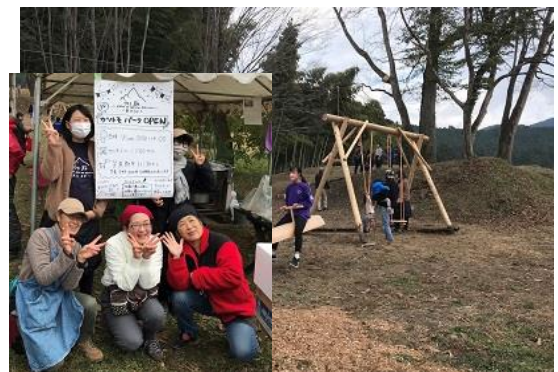
加蘇地区の新たな交流拠点