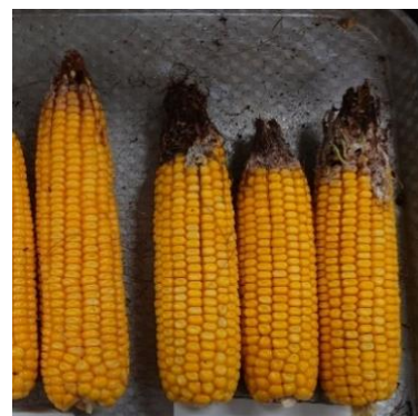
子実とうもろこし