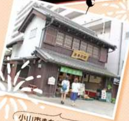
小山市まちなかの駅思季彩館