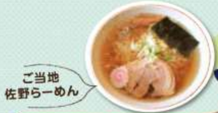
ご当地 佐野らーめん