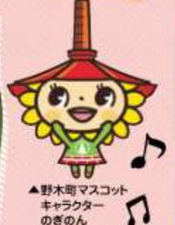
▲野木町マスコットキャラクターのぎのん