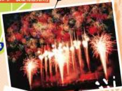
おやま サマーフェスティバル