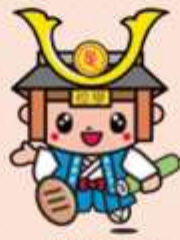
▲足利市イメージキャラクター たかうし君