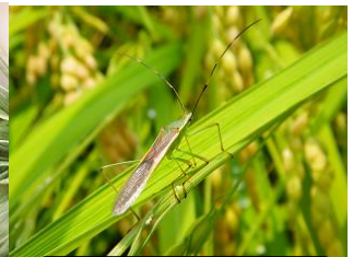
クモヘリカメムシ