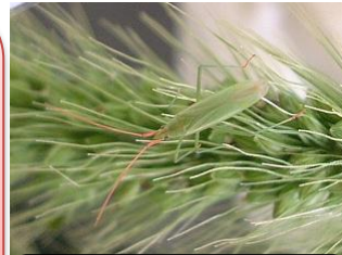
アカヒゲホソミドリ カスミカメ