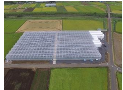
次世代トマト生産施設