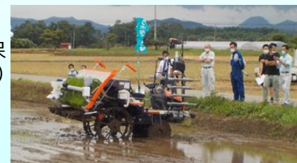
圃場整備地区での無人田植機の実演