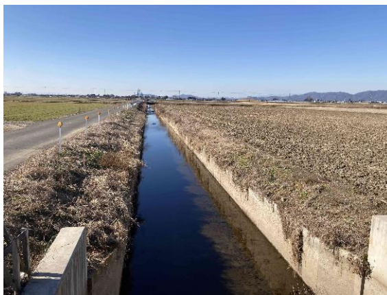
(西清水川支線排水路)