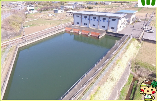
(大岩藤第2揚水機場と貯水槽)