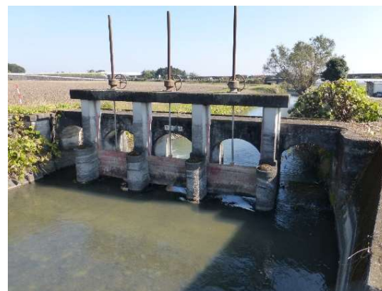
老朽化したゲート