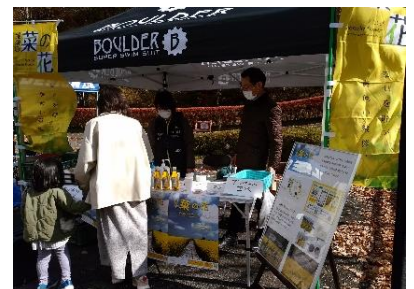
イベントでの菜の花プロジェクトPR