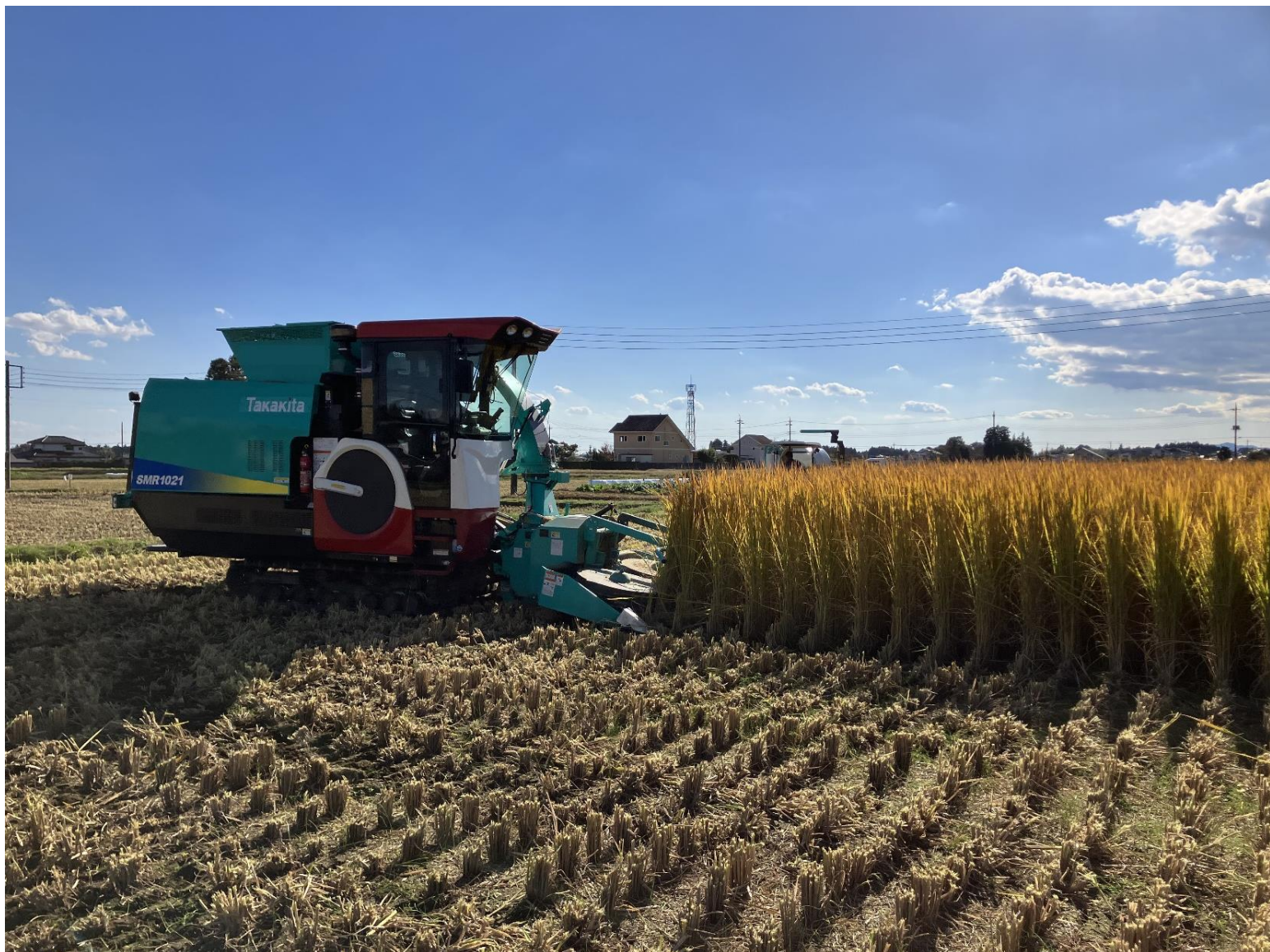
汎用型収穫機による飼料用稲の収穫