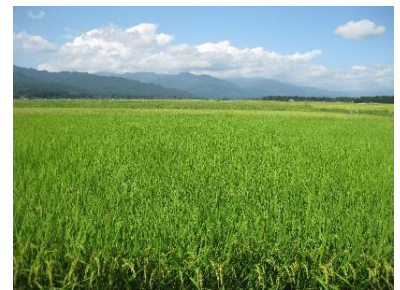
広大な水田が広がる那須野ヶ原