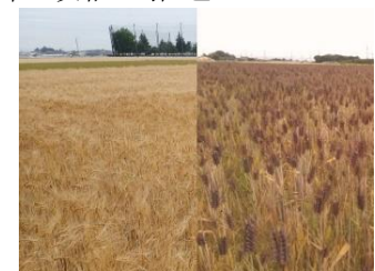
健康機能性を有する大麦

水田の大区画化や汎用化を進め、意欲ある担い手が効率的な営農を展開できるよう農地の集積・集約化を促進します。さらに、ICT等の技術を活用した省力化や露地野菜等の高収益作物の導入及び食品企業と連携した麦等の生産拡大により、経営の規模拡大や複合化を進め、水田農業の収益向上を図ります。