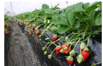
たわわに実るイチゴ

就農相談から営農定着までを一貫して支援する体制の充実や就農関連情報の発信強化を進め、新規就農者の確保・育成を図ります。また、新品種の導入や先端技術の活用、分業体制の構築等により稼げる産地づくりを進めます。