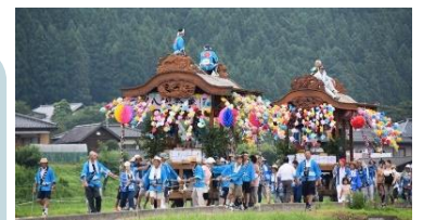
継承される伝統行事

地域活動の核となる人材・組織を育成するとともに、観光・商業施設等とも連携した都市農村交流活動の展開や農村の魅力の発信強化による関係人口の拡大を図ります。また、集落営農組織の体質強化や農村環境の保全活動、鳥獣被害対策を支援するとともに、農村地域の防災力向上を図り、安心して営農を続けられる元気でにぎわう農村づくりを進めます。