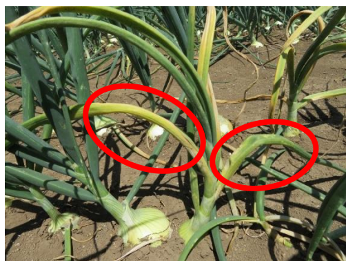
写真1 発病株（赤円内）

今後の1か月予報（2月15日気象庁発表）によると、気温は平年より高く、降水量は平年より多い予想のため、初発が早まる可能性があり、今後の気象条件では多発が警戒されます。適切に防除を行い、被害の発生を防ぎましょう。