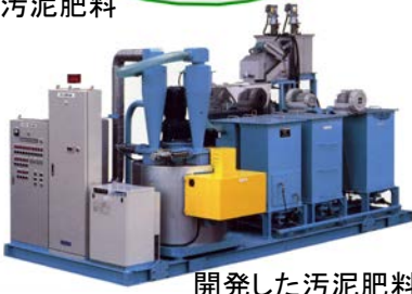
開発した汚泥肥料化装置