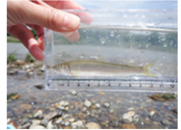
茂木地区 | テイテイ淵