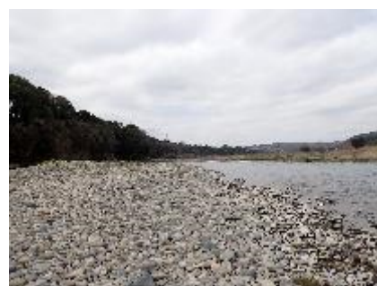
茂木地区 | テイテイ淵