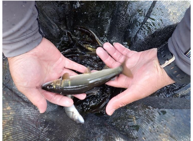
小川地区で釣れたアユ