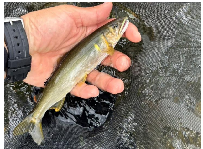
箒川で釣れたアユ