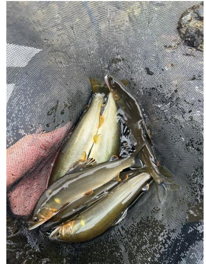
黒磯地区で釣れたアユ