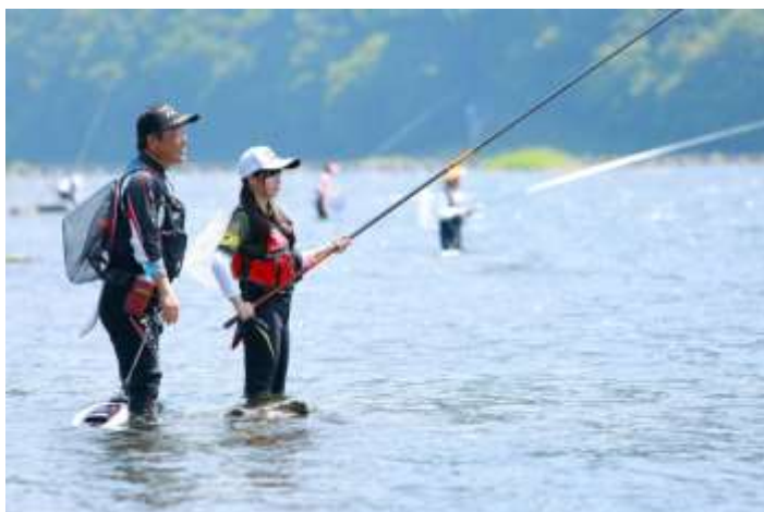
アユの友釣りを楽しむ女性遊漁者

漁場内の“瀬”や“淵”が、人為的な改変により、消失する事例が増加し、河川の生産力低下が懸念されています。そこで、河川に携わる漁協や土木行政部局とともに、河川環境の復元に向けた検討を行います。