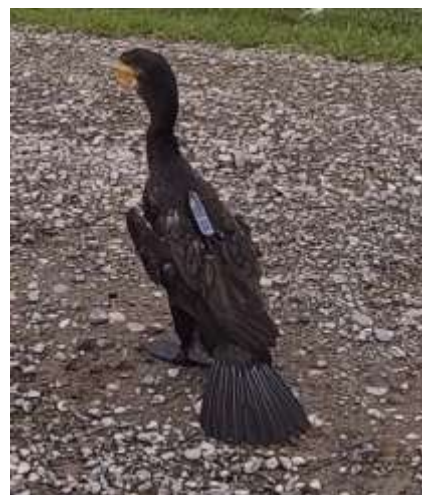
ロガーを装着したカワウ