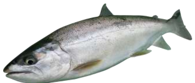
管理釣り場向けに開発した銀桜サーモン

ホンモロコやキンブナなど水田を活用した養殖漁業に対して、安定的な生産のために技術支援します。