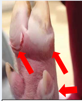
ひづめの水疱（水ぶくれ）